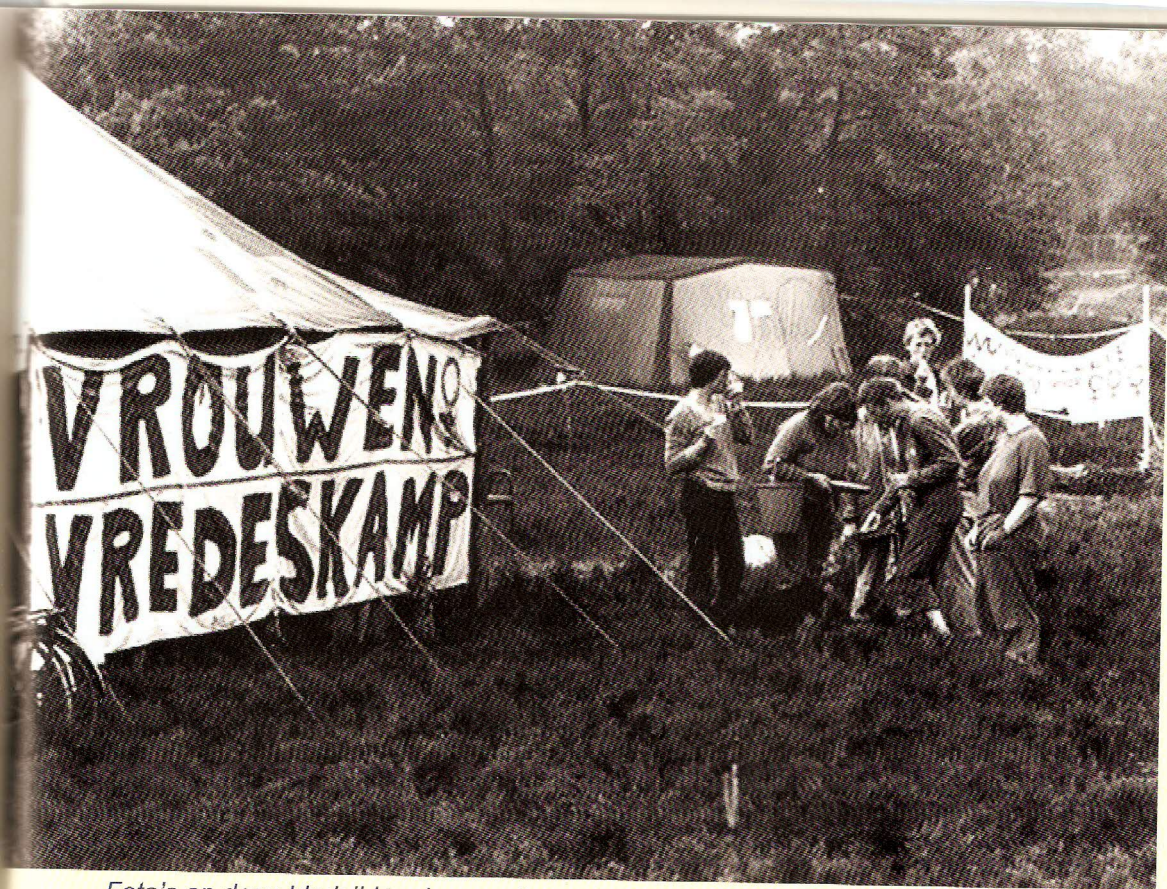
Foto's op deze bladzijden: Impressies van het Vrouwenvredeeskamp 1982

Dus die heeft zich er helemaal ingestort. En ze nam de hele Bonte Was mee, haha, dat waren al die radicale vrouwen van de vrouwenuitgeverij, ja die heette De Bonte Was . Ik heb hier een papier teruggevonden van de kerngroepvergadering van 22 april 1982, een maand voor de oprichting van het kamp. Dan komt de kerngroep, zo noemden we